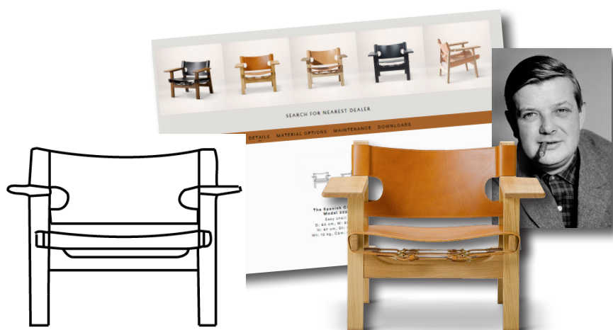
På Fredericias website kommer al produktinformation, stregtegninger, produktbilleder og relateret information direkte fra Perfion PIM-systemet

Med skiftet til Perfion er også virksomhedens arbejdsprocesser optimeret: Med afdelinger i både Fredericia og København er det en stor fordel, at medarbejderne nu har adgang til de samme informationer i ét fælles system, som alle kan arbejde i på samme tid.